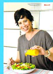
ヘザーさんも自宅でも挑戦。