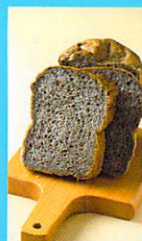
ホームベーカリーGOPANで、黒ごま入り米パンが完成。