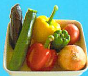
ザクザクソースとなめらかソースで、野菜が充分食べられる。

代謝アップ・むくみ対策・便秘解消 野菜力でデトックス、 ベジソースがおすすすめ。