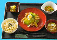
夏のカラダには、夏の食材を使った薬膳定食を。