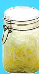
肥満解消と夏バテ防止に役立つ。