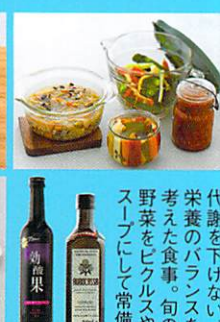
代謝を下げない栄養のバランスを考えた食事。旬の野菜をビクルスやスープにして常備。