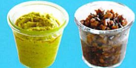
食物繊維で腸を活発に