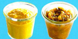
夏野菜でむくみ対策