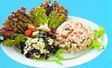
脂質の割合を減らして、未精製の炭水化物が主食。