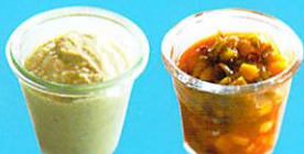
代謝を上げるソース